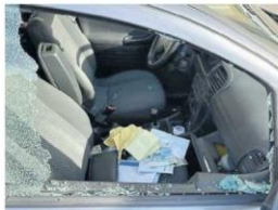
PERUGIA Un'auto spaccata in viale Roma